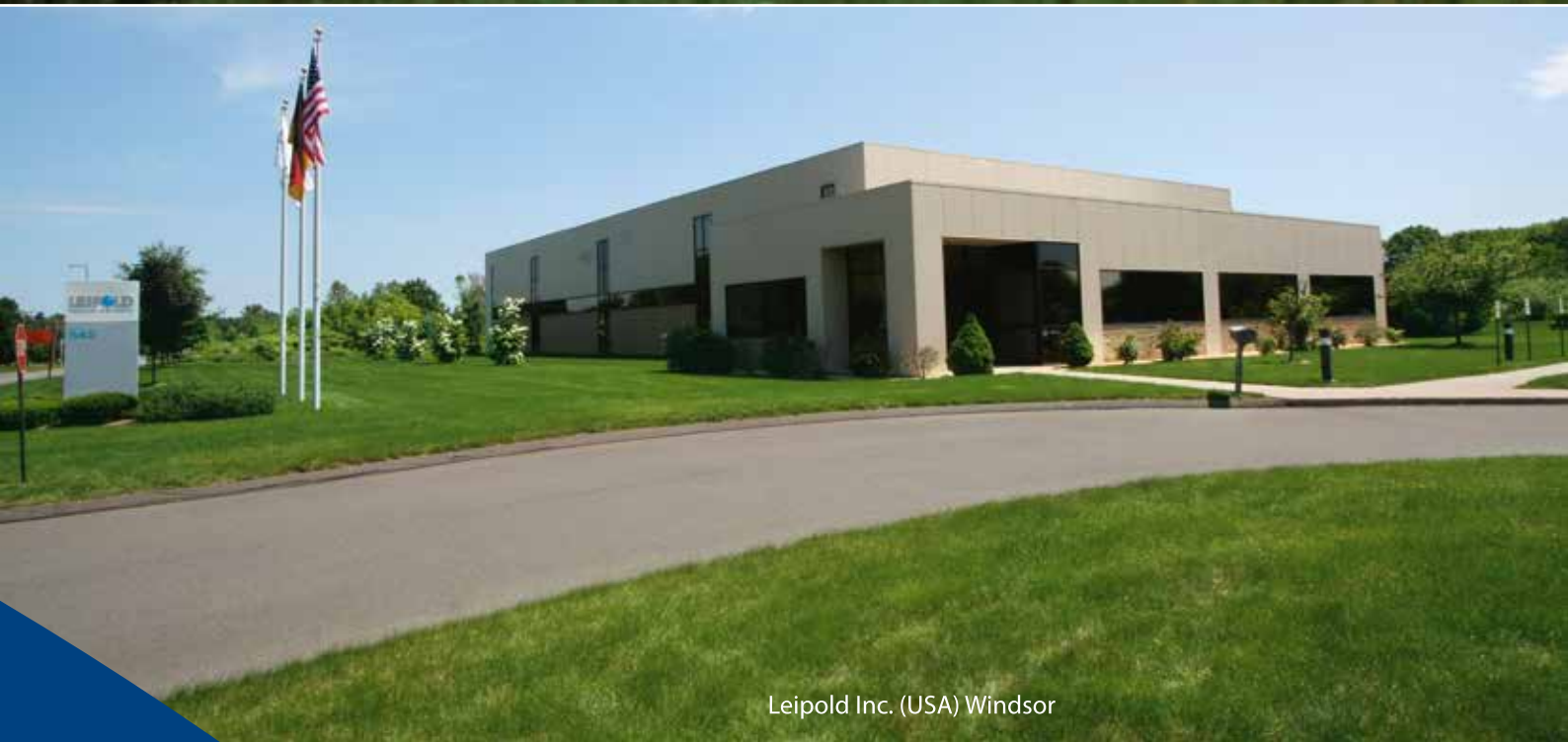
Leipold Inc. (USA) Windsor